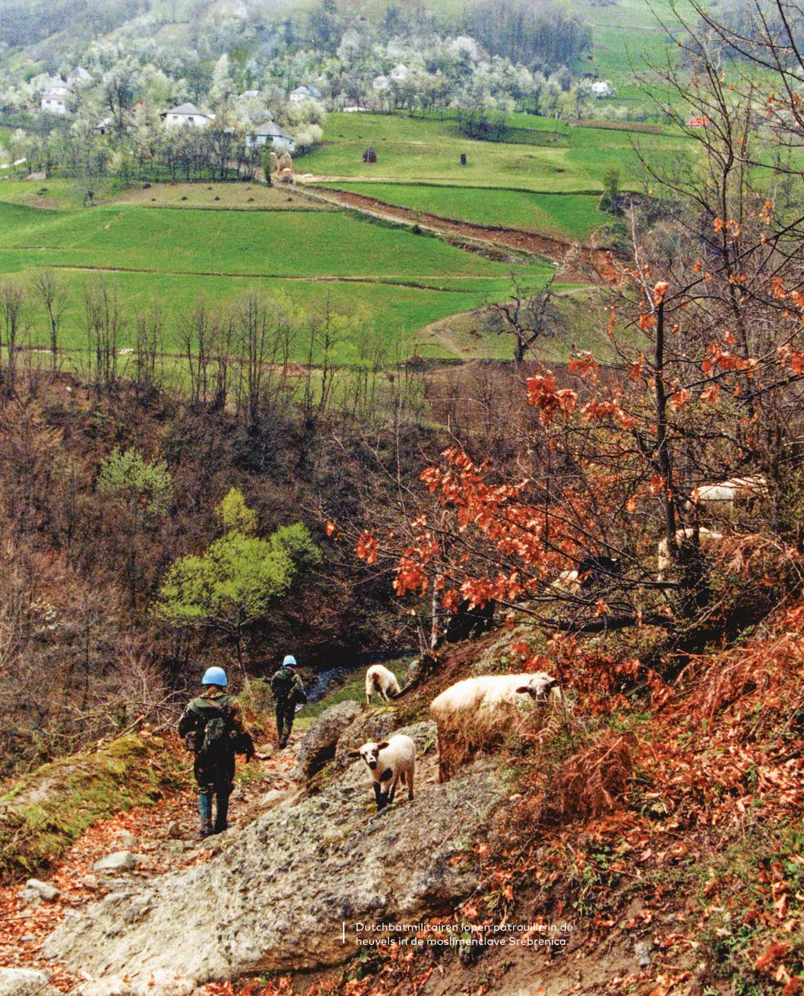
Dutchbatmilitairen lopen patrouille in de heuvels in de moslimenclave Srebrenica.

Srebrenica. Een verkeerd geschreven geschiedenis